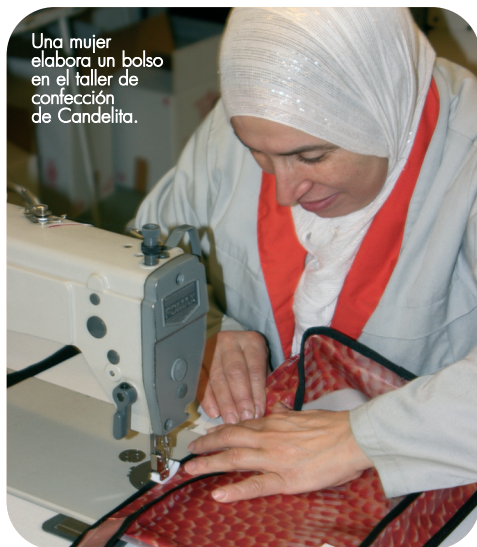
Una mujer elabora un bolso en el taller de confección de Candelita.